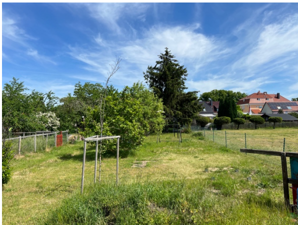
Abb. 6: Gepflegtes Grundstück mit Einzelbäumen und Neupflanzungen