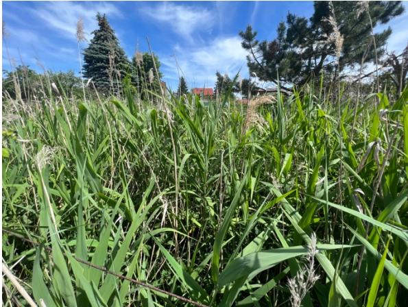
Abb. 8: Schilfbestand weist auf einen hohen Grundwasserstand hin