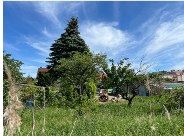
Abb. 5: Alte Obstbäume und ungemähter Ruderalbereich