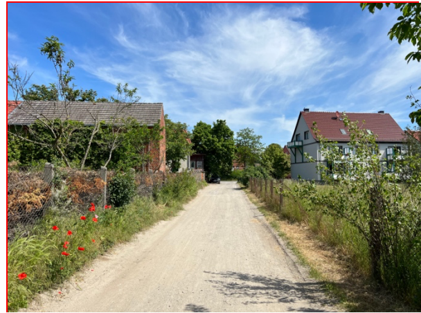
Abb. 3: Im Westen wird der Planungsraum durch die Straße „Im Sichenholz“ begrenzt (Blickrichtung Nord)