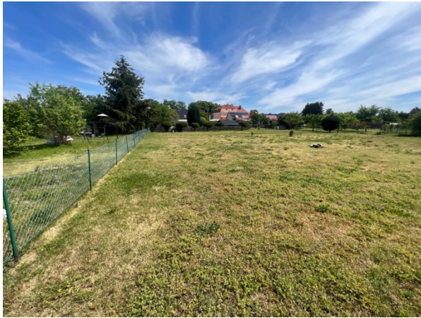
Abb. 4: Gepflegter Grünlandbereich ohne Baumbestand