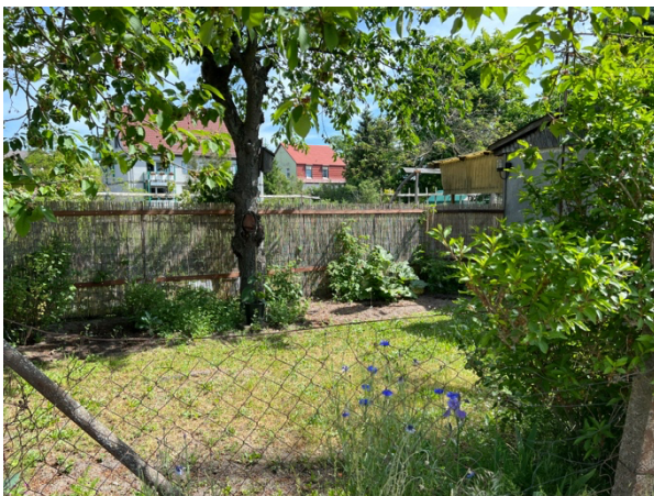
Abb. 10: Kirschbaum und Gartenrabatten auf dem Eckgrundstück