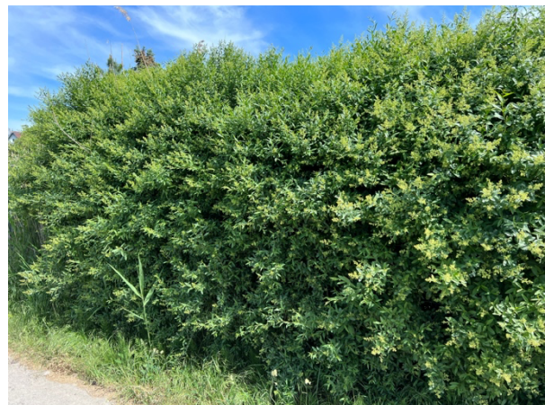
Abb. 11: Heckenzug entlang der Nürnbergstraße