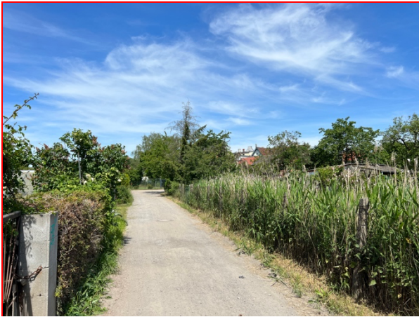
Abb. 2: Im Süden wird der Planungsraum durch die Nürnbergstraße begrenzt (Blickrichtung West)