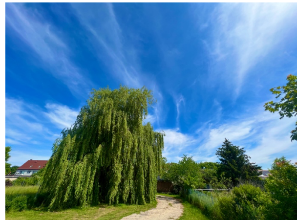
Abb. 7: Trauerweide innerhalb des Geltungsbereiches