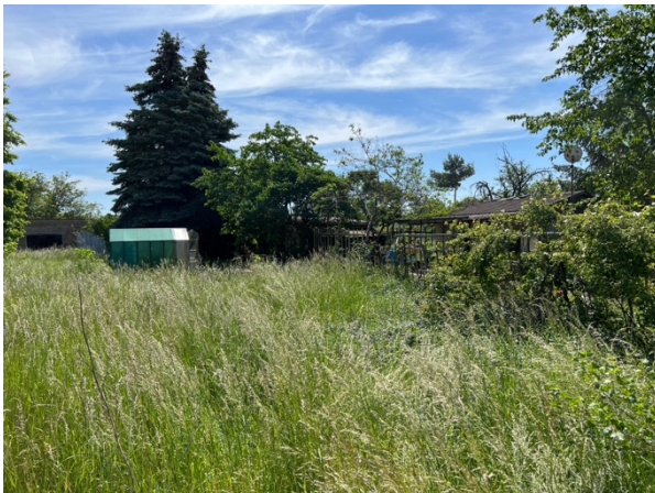
Abb. 12: Grünlandbrache ohne Frühjahrsmahd