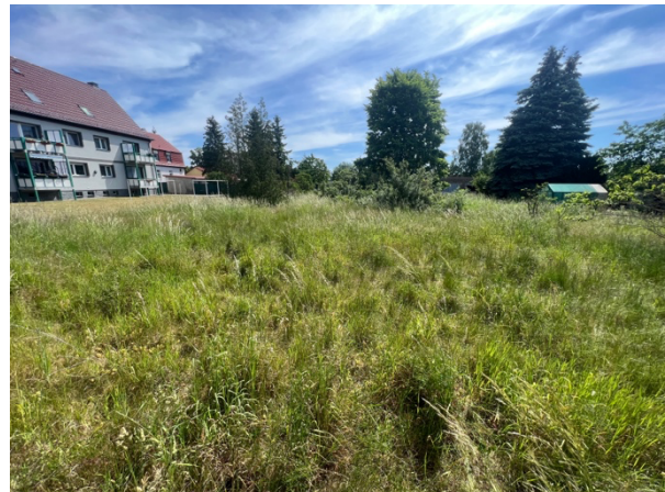
Abb. 13: Grünlandbrache ohne Frühjahrsmahd