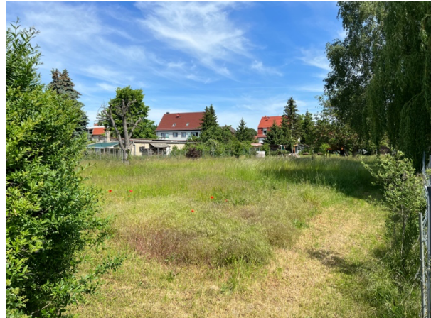
Abb. 9: Grünlandbereich mit Mahd auf Teilflächen